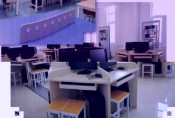
一体化课程教学设计综合实训室