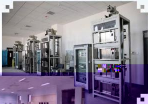
智能电梯安装调试维护训练场所